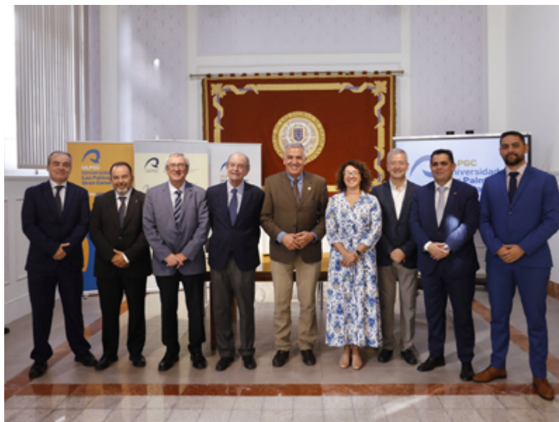
Representantes de las distintas asociaciones y colegios oficiales, con los firmantes de la Cátedra del REF

Además, el convenio contempla la realización de ciclos de conferencias y la difusión de artículos periodísticos para explicar el significado, origen y evolución histórica del REF, con el objetivo de que la sociedad canaria comprenda la importancia y los efectos inmediatos de esta normativa. También se realizarán análisis en conjunto con las asociaciones empresariales y profesionales para abordar los puntos conflictivos del REF en cada momento y buscar soluciones pertinentes.