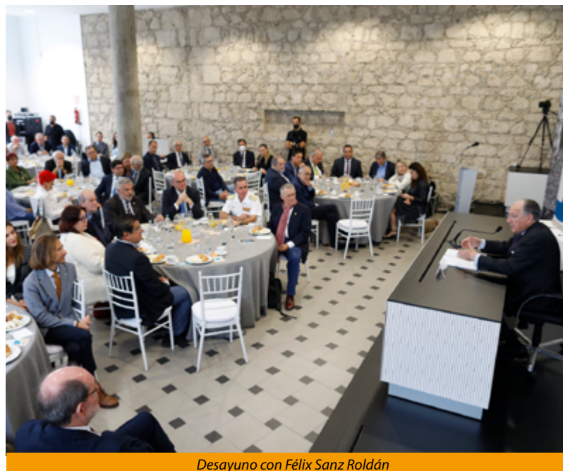
Desayuno con Félix Sanz Roldán

Félix Sanz Roldán, presidente del Consejo Social de la Universidad de Castilla-La Mancha, intervino en los Desayunos Universidad-Sociedad que organizó el Consejo Social de la ULPGC. Este evento congregó a noventa invitados, entre diferentes autoridades, empresarios y personal docente de la ULPGC que acudieron al Aula de Piedra de la Sede Institucional para escuchar al que fuera director del Centro Nacional de Inteligencia (2009-2019) y exjefe del Estado Mayor de la Defensa (2004-2008), que ofreció la conferencia 'Hacia un nuevo orden mundial'.