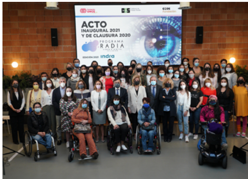
Foto de familia del Programa Radia.

El programa, por el que ya han pasado casi un centenar de mujeres con discapacidad, está impulsado por Fundación ONCE, Fundación CEOE y la Conferencia de Consejos Sociales de las Universidades Españolas. Además, cuenta con el apoyo de Minsait, una compañía de Indra.