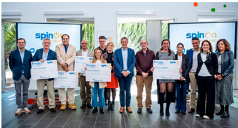
Entrega de premios programa 'Spin On'

Estas convocatorias forman parte del programa SPIN-ON de la ULPGC, el cual tiene como objetivo la creación y consolidación de empresas de base tecnológica e innovadoras. El programa, salvo estos premios, cuenta con la financiación de la Consejería de Economía, Conocimiento y Empleo del