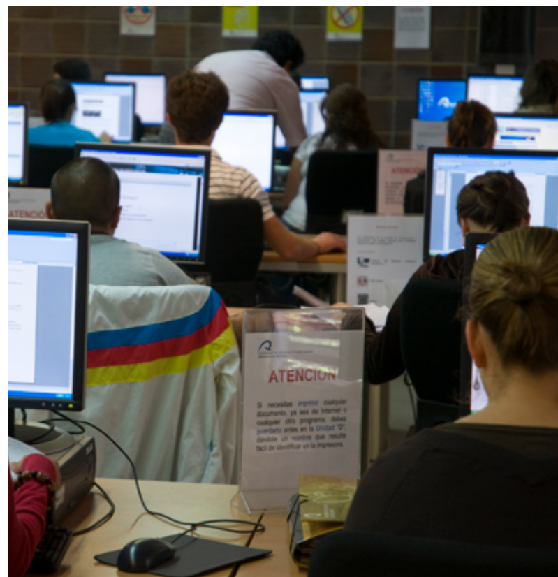
Alumnos de la ULPGC

A esta convocatoria de ayudas del Consejo Social de la ULPGC se presentaron un total de sesenta y siete estudiantes que cumplían con los criterios establecidos, como estar matriculados al menos en su segundo año de estudios de doctorado y contar con una nota media mínima. El Consejo Social ha destinado estas ayudas a los trabajos de investigación que se llevan a cabo en todos los programas de doctorado ofrecidos por la ULPGC.