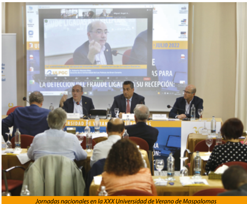
Jornadas nacionales en la XXX Universidad de Verano de Maspalomas

Este curso contó con la presencia de destacadas personalidades con responsabilidades en tareas de fiscalización y del entorno universitario procedentes del Tribunal de Cuentas Europeo, del Tribunal de Cuentas de España, de diferentes Instituciones de Control Externo, de universidades públicas y de sus consejos sociales.