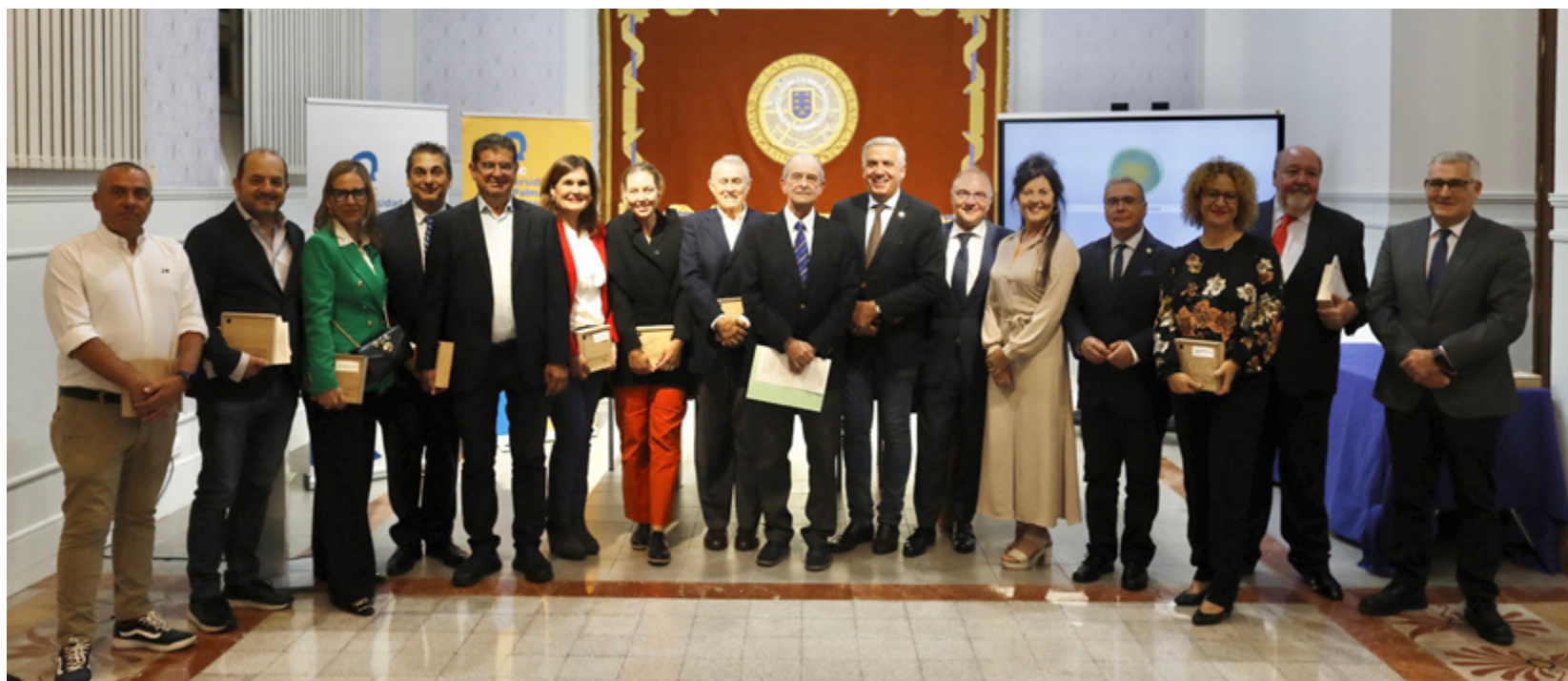
Reconocimiento a los Dinamizadores de la iniciativa "Canarias Importa"

Además, como muestra de agradecimiento por su colaboración con esta iniciativa, el Gobierno de Canarias y el Parlamento de Canarias también recibieron la escultura.